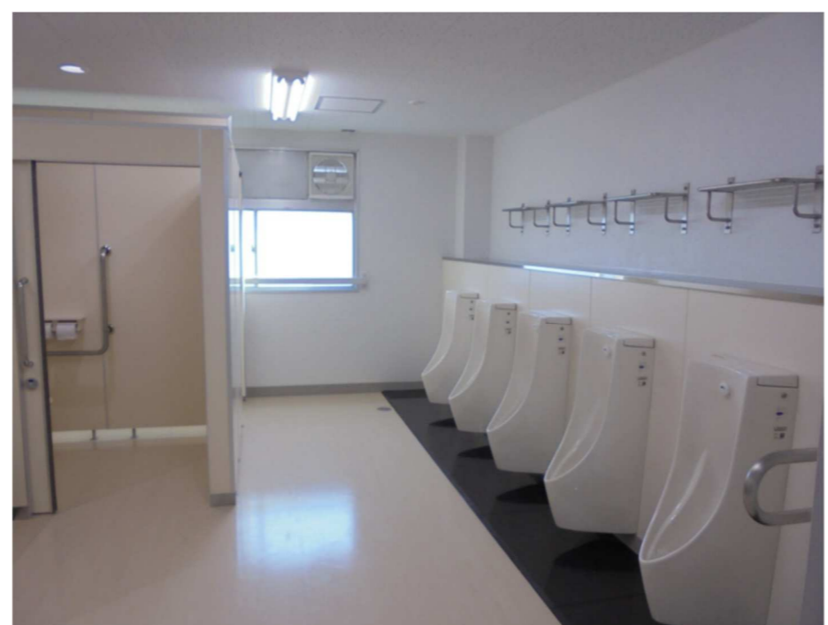
トイレ改修（ドライ化）工事

教育委員会が策定した修繕計画に基づき、建築局・建築保全公社が改修工事を担当しています。