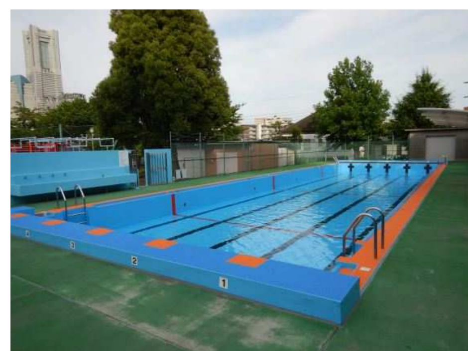
水泳プール改修工事