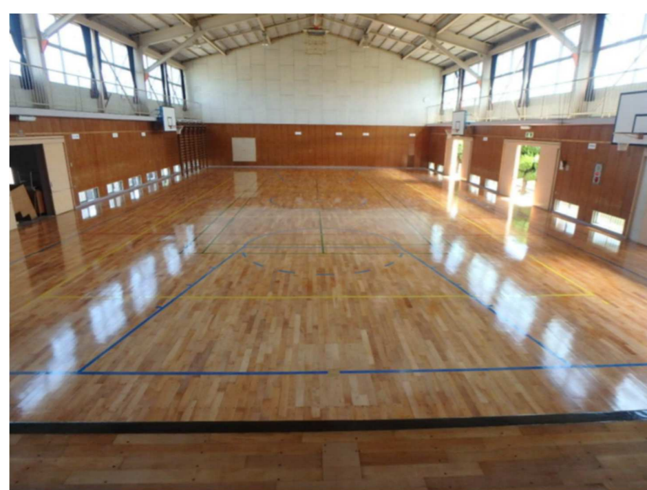
屋内運動場床改修工事