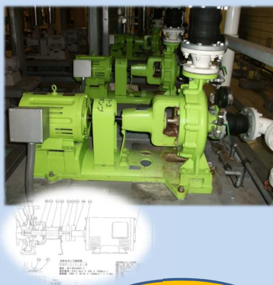
冷温水ポンプの オーバーホール

日時 平成30年1月27日(土) 午前10:00~11:30 場所 横浜能楽堂(横浜市西区紅葉ヶ丘27-2) 参加費 無料(どなたでも参加できます) ※先着50名 主催 (公財)横浜市建築保全公社 申込方法 裏面又はホームページをご覧ください( http://www.y-hozen.or.jp ) お問い合わせ 045-349-5217(横浜市建築保全公社 技術管理課 技術管理係)